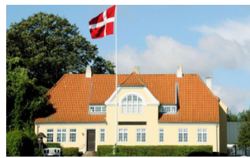
”Jenle” Jeppe Aakjærs